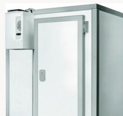
Une chambre froide de 20m 2 pour vos boissons/desserts