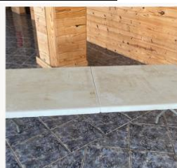
10 tables pliantes si besoin (table mariés, buffet et autre) Dimension de 1,8m sur 0,75m