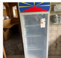
2 vitrines réfrigérées de 340 litres chacun