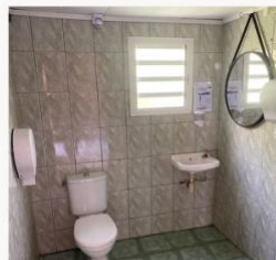
Sanitaire avec fournitures (papier toilette, lave main, savon, serviette papier)