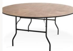
15 tables rondes en bois pour 180 personnes max (15x12 Personnes). Diamètre 1,8 mètres