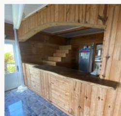
Un bar pour stocker vos boissons (extérieur)