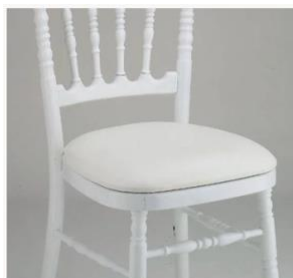
180 Chaises Napoléon Blanches