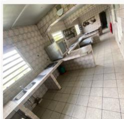
Une cuisine pour votre traiteur comprenant : (2 plans de travail, 1 table, 3 éviers et 1 prise 380 volts)