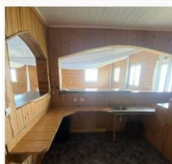
Un bar pour stocker vos boissons (intérieur)