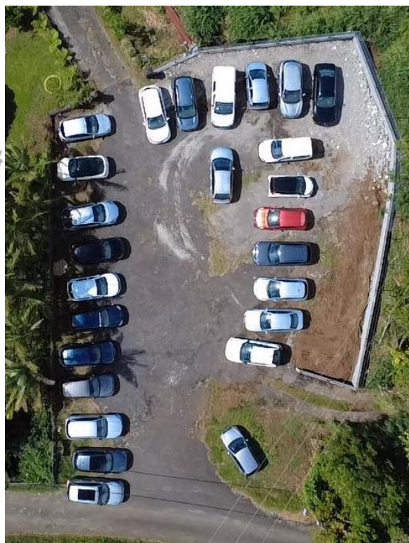
Règlement d'utilisation du parking – Le Saint-Ignace